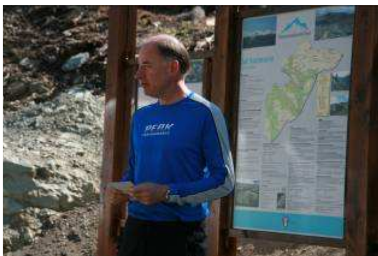
Ordføreren opnar kulturminne Rustgruvene