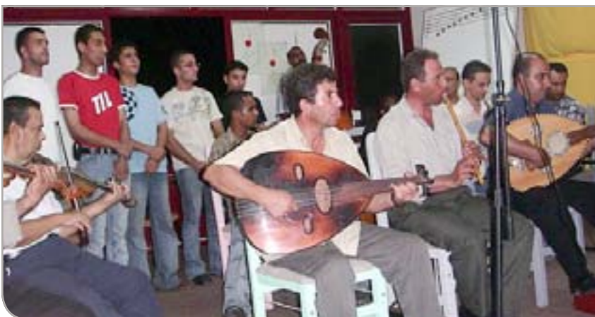
Representanter fra Tromsø besøkte Gaza i 2006.