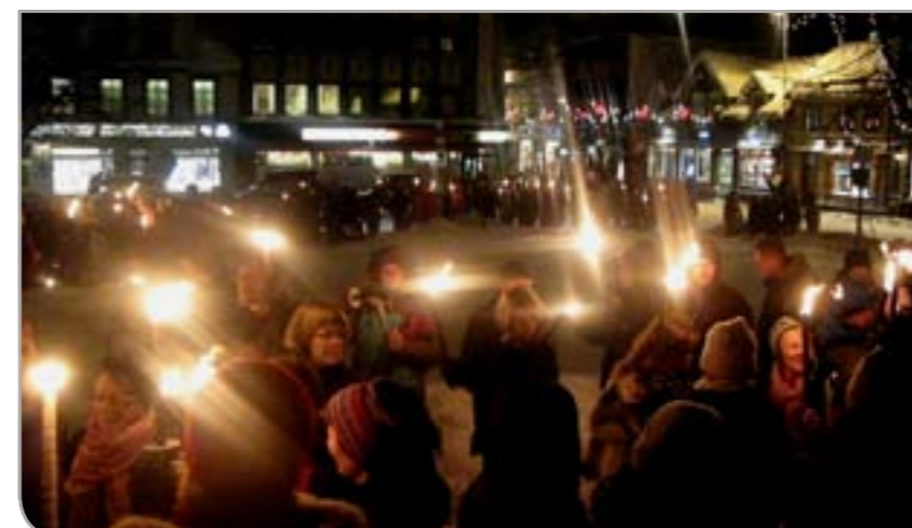
Demonstrasjon i Tromsø under krigen i Gaza i januar 2009.

Mange har vært engasjert; først og fremst et stort antall aktivister både i Gaza og Tromsø. Engasjementet til kjente fagfolk