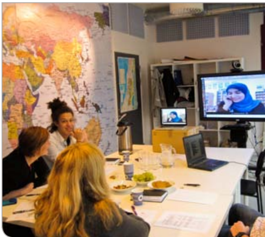
Videokonferanse mellom Tromsø og Gaza.

ungdomsfilmsenter og videokonferansesenter i Gaza, har jobbet med idrettsaktiviteter og animasjonsfilm, og har bredt sitt