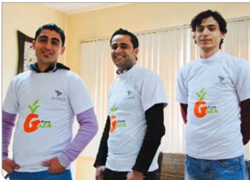
Tre av våre venner i Gaza med nye Vennskap Tromsø-Gaza-t-skjorter

med under NUFF. Det ble laget kortfilmer, og ungdommene fra Gaza hadde også med seg film fra hjembyen sin. Hvert år siden har NUFF hatt kontakt i Gaza, men det har blitt stadig vanskeligere å få til besøk. Når ikke folk fra Gaza kan komme til NUFF kommer NUFF til dem; de siste årene har det vært arrangert parallelle workshops i Gaza som har vært delt med festivalen i Tromsø på internett. 2006 var også året for lansering av vennsgruppas nettside tromso-gaza.no .