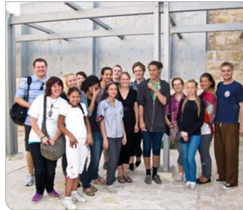
Palestinakomiteens ungdomsgruppe i Tromsø på tur i Palestina.

en egen demokratisk stat slik de andre arabiske landene nå utvikler seg til. Da kan palestinerne fritt fiske i Middelhavet, og samarbeidet om fisk utvikler seg mellom våre to byer. Da reiser vi like gjerne til Gaza på badeferie og filmfestival, som palestinerne kommer hit på nordlyssafari eller konferanser. Mulighetene er uante. Kanskje kan vi komme i en situasjon der vi behøver vennskapet like mye som de trenger vårt nå. Palestinerne glemmer aldri hvem som er deres virkelige venner. 🌊