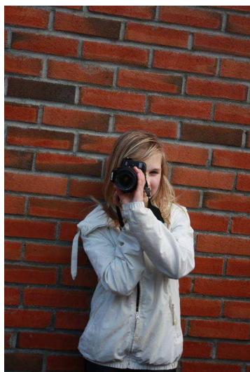
FOTO / Billedbehandling Helgekurs