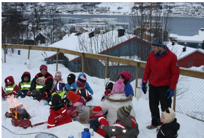
Vi feirer samefolkets dag 2009 ute med bål.

Alle som får tilbud om plass hos oss får tilsendt foreldreorientering. I denne finnes det meste av praktisk informasjon om det å ha barn i Hvilhaug barnehage.