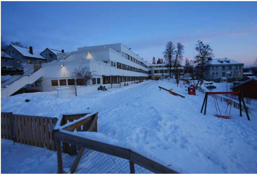
Den blå timen før vi går ut i februar.