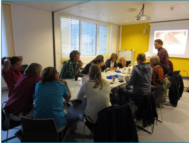
Klinikkbesøk i forbindelse med gjennomføring av et praksisnært forskningsprosjekt i TkØ sin region