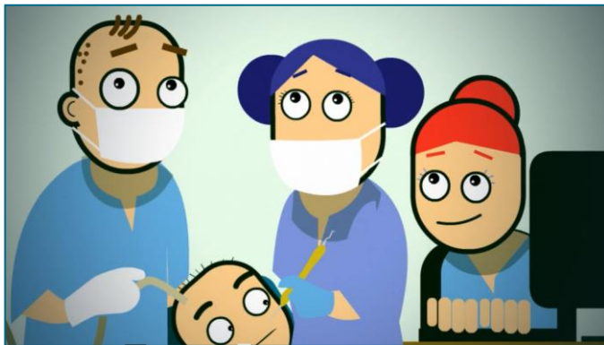
Et TOO-team består av tannlege, tannhelsesekretær og psykolog.

TkØ har siden 2012 hatt et TOO-behandlingsteam. TOO er et tilrettelagt tannhelsetilbud til torturofre, overgrepsofsatte og til pasienter med odontofobi. Pasientene blir enten henvist fra lege, tannlege, tannpleier, psykolog eller de tar selv direkte kontakt. TOO-temaet består av psykolog, tannlege og tannhelsesekretær. Tilbudet innebærer eksponeringsterapi med mål at pasienten skal bli i stand til å motta tannbehandling. Dette kan i mange tilfeller være tidkrevende. I 2016 var 198 pasienter gjennom TOO-behandling hos TkØ.