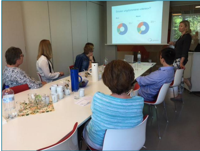
Tannpleiere fra ØFK på besøk hos TkØ