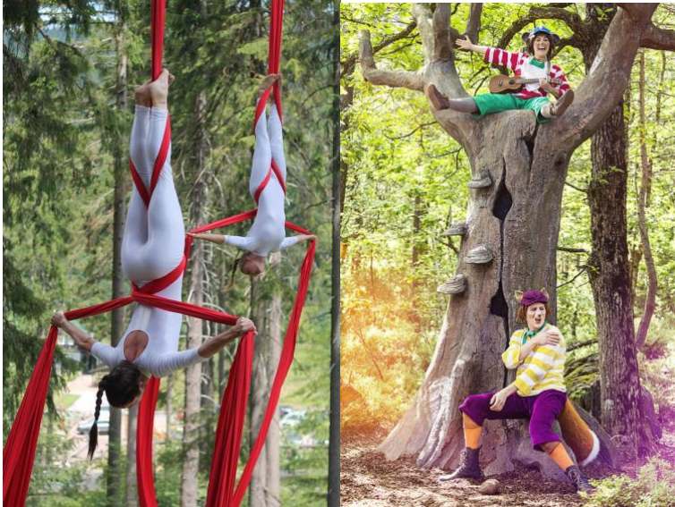
Foto: Akrobat og Klatremus i Dyreparken i Kristiansand.

Foreldre står som vakter langs løypa og går sammen med elevene i forkant/bakkant av løypa.