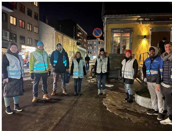
Sagene skole og Bjølsen skole- januar 2022