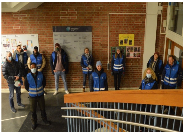
Nordpolen skole

FUT og SaLTo har inngått et samarbeid med FAUene ved Nordpolen skole, Bjølsens skole og Sagene skole for å felte på kveldstid for en tryggere bydel.