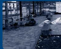
...vedlikehold og utvikling...