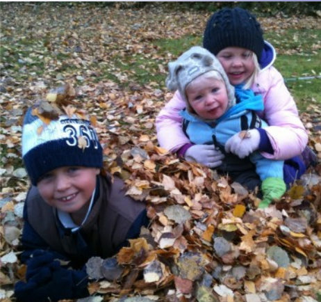
Dugnad på Bønsnes

Det er fortsatt omveiene, forsinkelsene og sidesporene som beriker ens liv