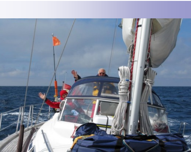
På vei over Nordsjøen