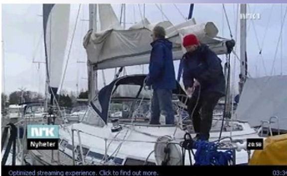
Som en av de første som krysset Skagerak i år kom vi på riksdekkende NRK-TV og radio.