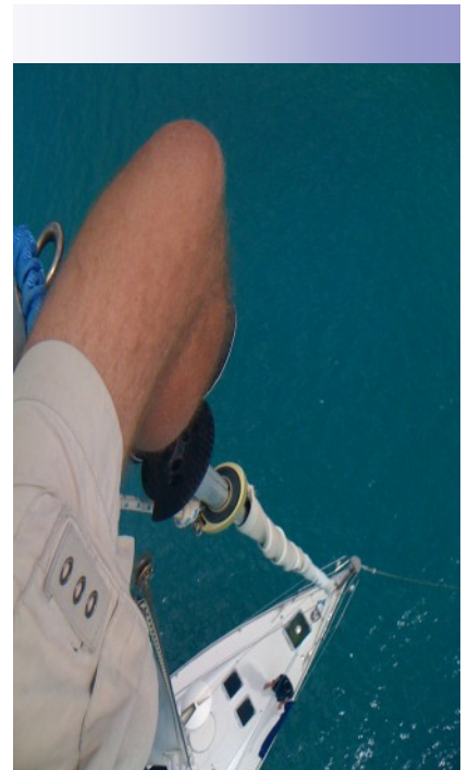
Per feirer 60-årsdagen i toppen av masta.

Dessuten har vi hatt et opplevelserikt år som vi gjerne deler med dere