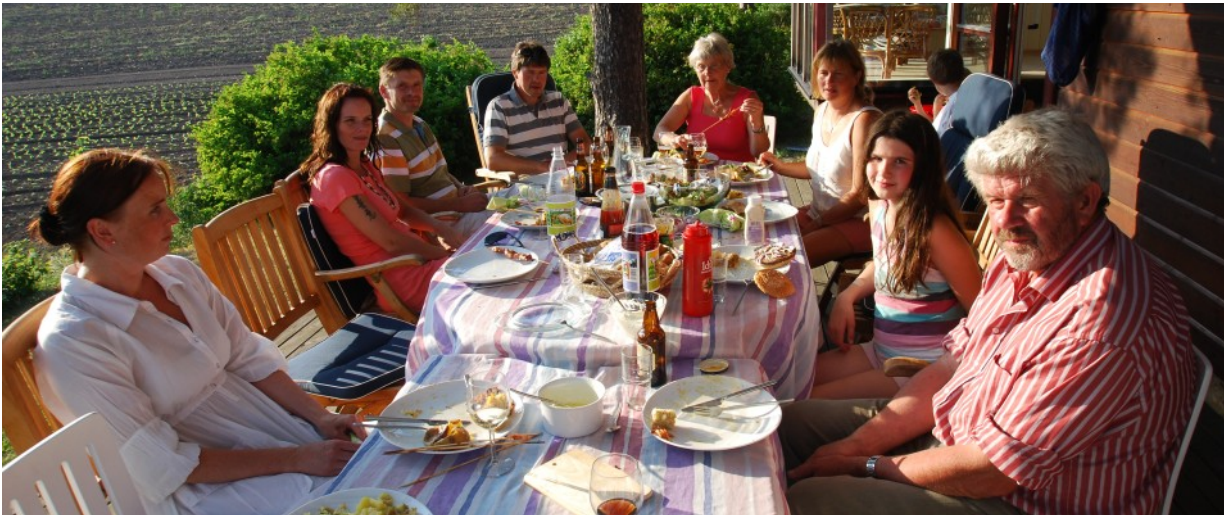
Koselig sommerbesøk fra familien Hval