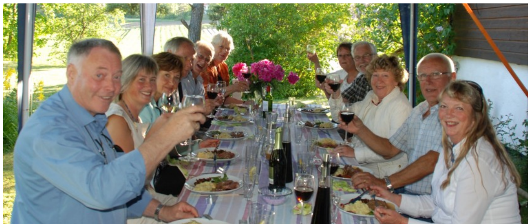
Fra fetter og kusinetreffet på Bonsnes i juni.