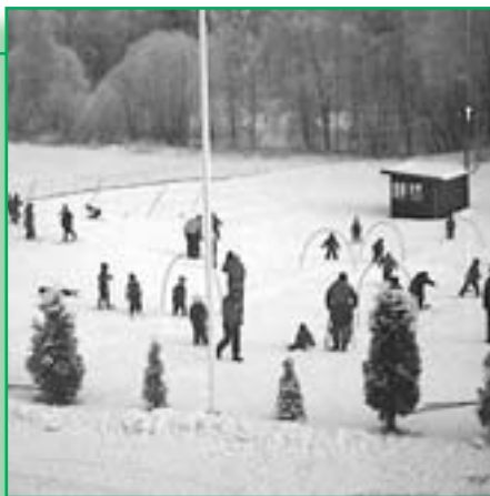
Skullerudstua 31.01.01 kl. 13.20

Så selv om det regner og er snøfritt utenfor ditt stuevindu, kan turforholdene gjerne være meget gode i Marka. Det kan du internett-datum.