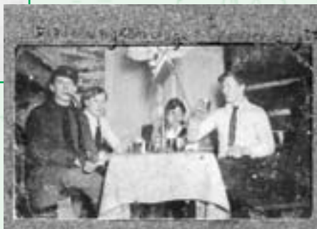
Glade ungfarsdager på Bremsrudhytta