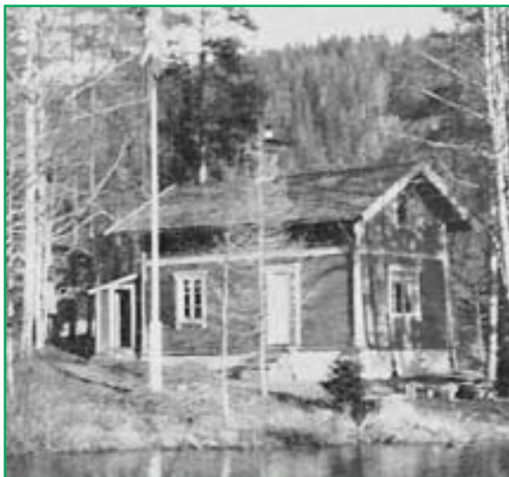
Speed-hytta ved Elvåga. Fra boka Speed gjennom 50 år.

En høstkveld like før krigen skulle jeg, som ofte ellers, til Speed-hytta. Fra Sarabråten tok jeg opp til Hauktjern for å gå snarveien. Da kom tåka. Jeg så ikke en meter foran meg i kveldsskumringen.