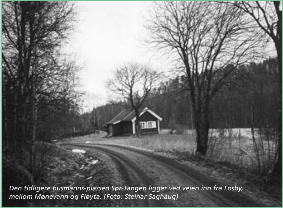
Den tidligere husmanns-plassen Sør-Tangen ligger ved veien inn fra Losby, mellom Mønevann og Fløyta.

stiftet vi bekjentskap med hjorteflua (lusa), en skapning ingen av dem ante eksisterte. Her fikk alle oppleve den på nært hold.