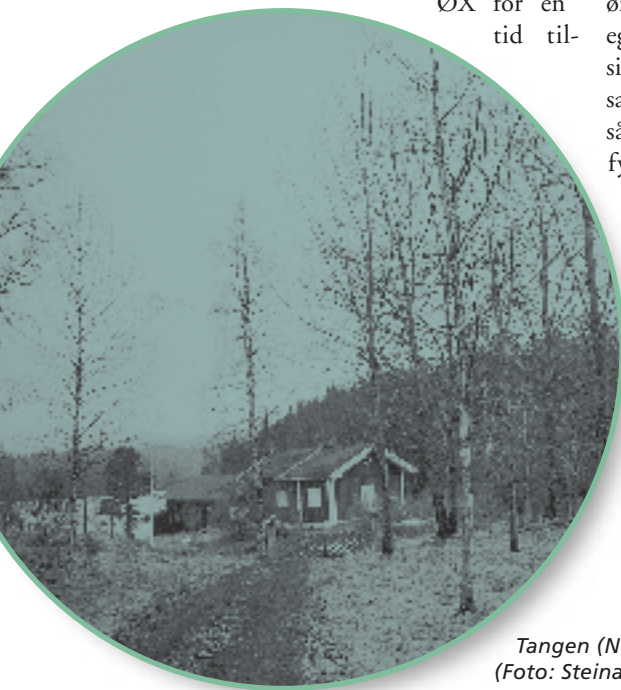
Tangen (Nord-Tangen) ved Mønevann.

Kunne vi benytte en torsdag ettermiddag på en bedre måte?