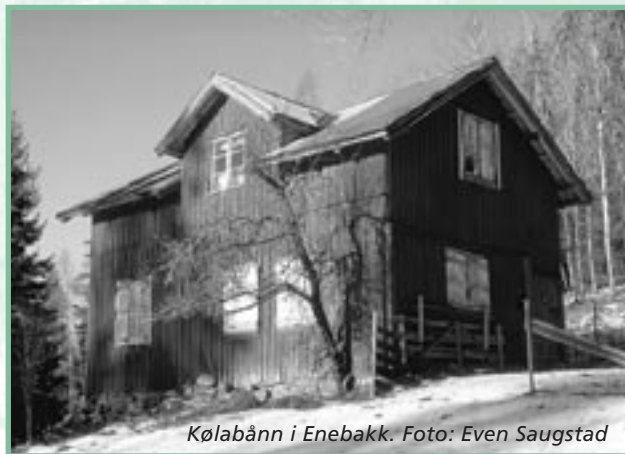
Kølabånn i Enebakk.

Som en kraftig fure i terrenget, skjærer Fudalen (av fu – tilsvarende det folkelige «ræv»!) seg gjennom Østmarkas østre del fra Kirkebygda i Enebakk helt til Nordby i Rælingen. Lengst i sør mot Børter finner vi en stor sandavsetning som forteller oss