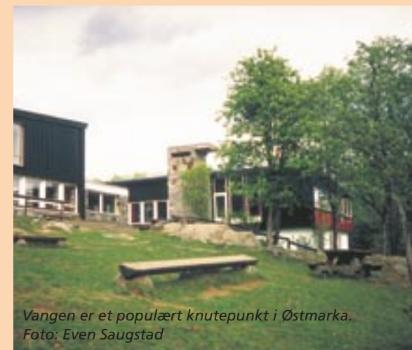
Vangen er et populært knutepunkt i Østmarka.