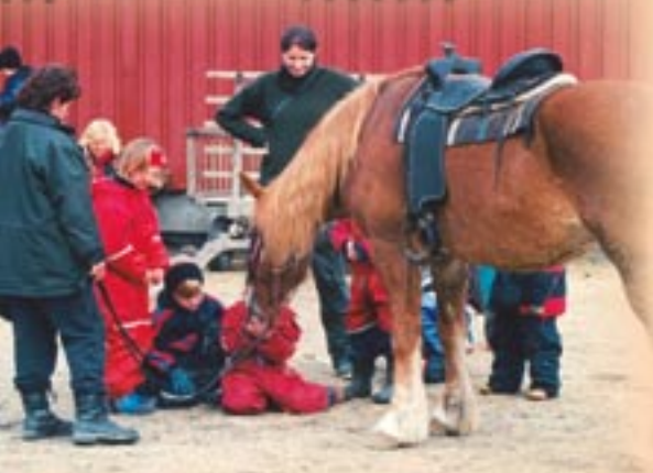
Dyra er et populært trekkplaster for de yngste som besøker Vangen.

til skoler og barnehager. – Firmaer som leier seg inn for en natt ser på dette som en artig kuriositet og lar seg ikke skremme av køyesenger og do på gangen, sier Lars.