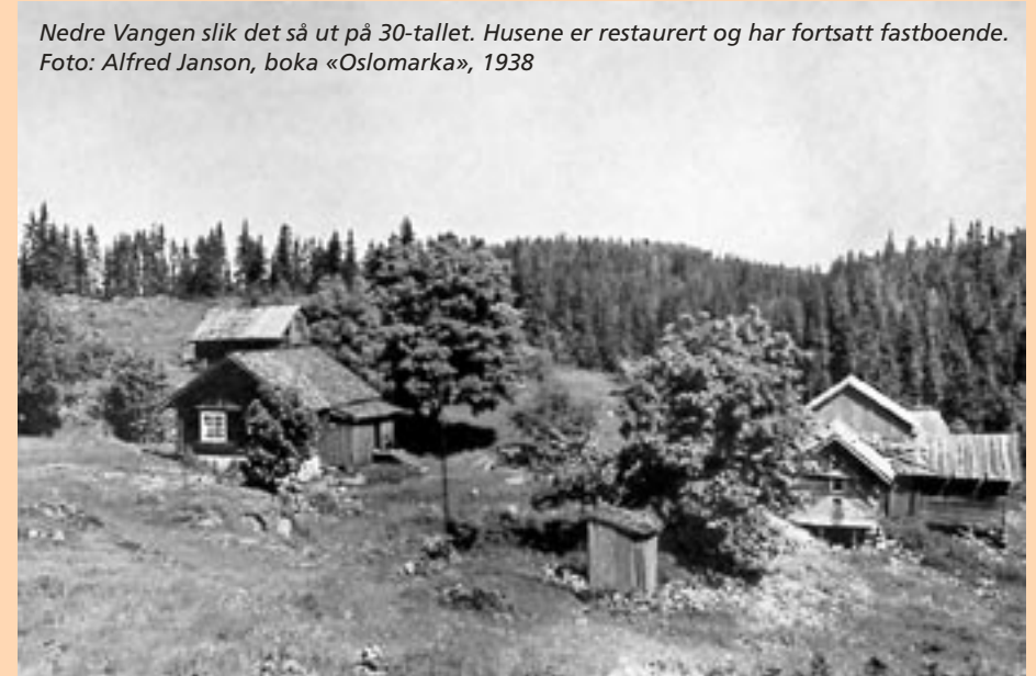
Nedre Vangen slik det så ut på 30-tallet. Husene er restaurert og har fortsatt fastboende.

sund og flere beverhytter som er bebodd, kan friste mange. For dem som vil ha lengre turer, er det kort å bære over til Tonevann eller Rausjøen og eventuelt trille videre til det store Børtervann. Med Tonekollen, Kjerringhøgda og Østmarka naturreservat tett ved, er det også mange spennende fotturmål i området. Flyktningeruta går også over tunet på Vangen.