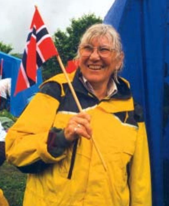
Vinnersmil i Tjekkia 1997. Har nettopp fått vite at jeg har vunnet.