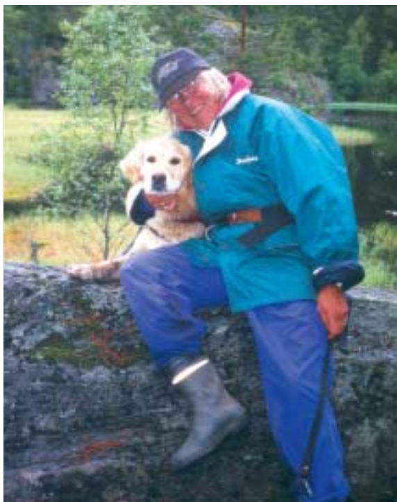
Ved Åmotdammen 27. juni 1999

Den Norske Turistforening, vinter som sommer. Og opplevd soloppgangen fra Galdhøpiggen. Siste tur som turleder gikk til Madeira i 1998.