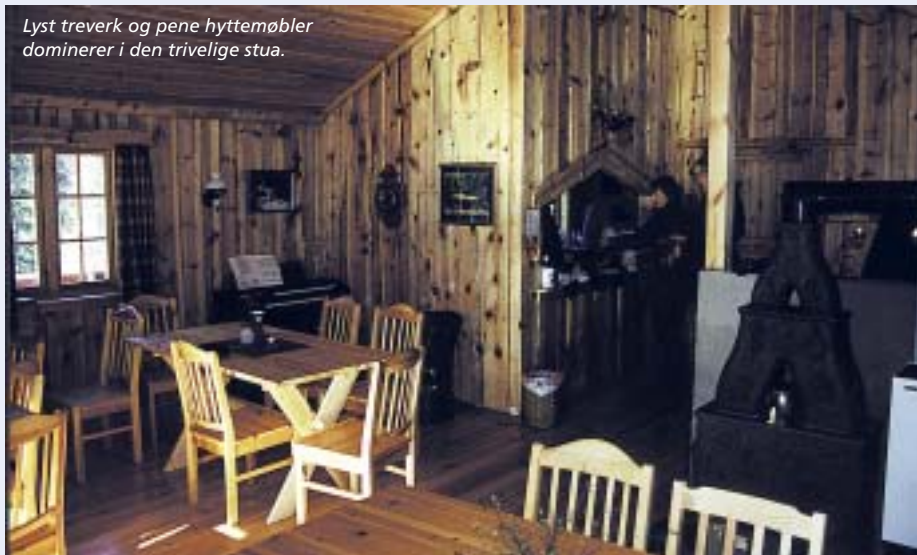
Lyst treverk og pene hyttemøbler dominerer i den trivelige stua.

– Vi har merket et stadig økende besøkstall, og her kommer både gamle og unge, sier han, og forteller at det på en god søndag kan komme omkring 100 mennesker innom stua. Regnværsdager med kun et par besøkende er ikke så oppløftende for dugnadsgjengen som driver serveringen, men folk skal vite at hytta er åpen hver