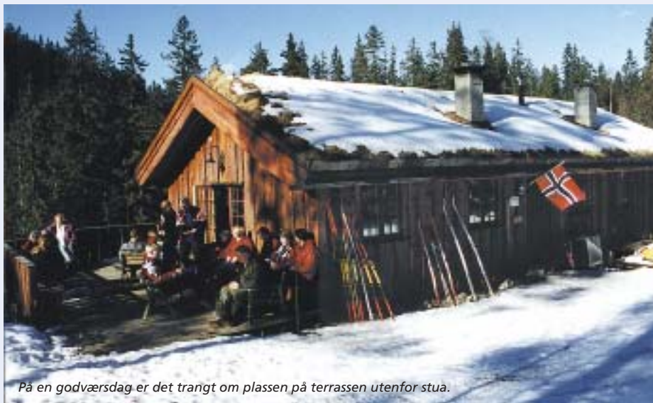
På en godværsdag er det trangt om plassen på terrassen utenfor stua.

søndag med unntak av juli og de kaldeste og mørkeste vintermånedene. Menighetene i Rælingen, Lørenskog og Skedsmo står i hovedsak for driften av stua. Disse sørger også for andaktsholder hver søndag.