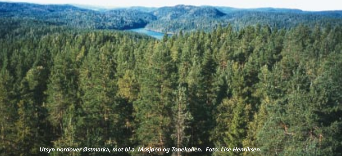
Utsyn nordover Østmarka, mot bl.a. Mosjøen og Tonekollen.

kunne formidle brannmeldingene raskt. Utstyret i tårnet bestod foruten telefon av kartbord, kikkestasjon og siktediopter. Den 30. juli 1942 oppstod ikke mindre enn tre branner i løpet av én dag, henholdsvis én, seks og åtte kilometer fra Kjerringhøgda. Da var det godt å ha telefon. På denne tiden fantes det 61 brannvaktstasjoner i de åtte østlandsfylkene, med en avstand på rundt 30 km mellom tårnene. De ble beregnet å ha ca. 20 års levetid, men som vi har sett, satte ofte forfallet inn etter bare rundt ti år. Branntårnene stod jo temmelig utsatt til for vær og vind, på de høyeste toppen og koller.