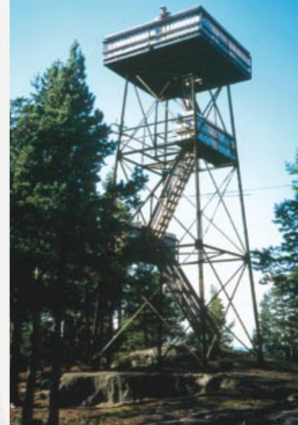
Det nyrestaurerte utsiktstårnet fra 2000.

Kristi Himmelfartsdag den 25. april 2003 møtte rundt 40 personer opp på Kjerringhøgda til gudstjeneste i regi av Enebakk kirke – en vakker og høytidsstemt stund, såvidt vites den første i sitt slag her oppe, men neppe den siste.