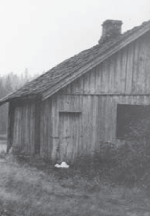
Furubråtan og Børtervann på 1970-tallet.