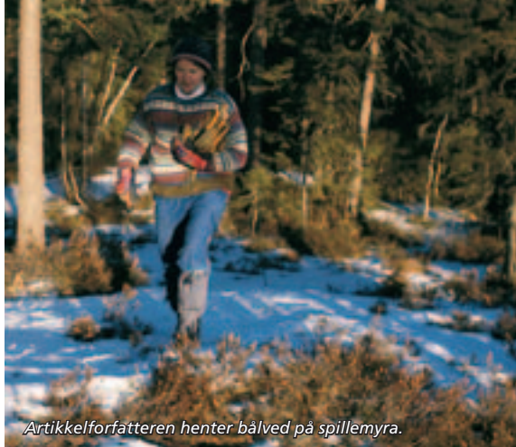
Artikkelforfatteren henter bålved på spillemyra.

Nå mørkner det ganske raskt, og jeg har ingen tid å miste. Overalt surkler vannet, og gjørmen pipler fram her og der, for nå er det så umiskjennelig vårløsning i Østmarka. Slik det har vært hver eneste vår siden tidenes morgen. En hektisk, men herlig tid, etterat vinteren til slutt har kapitulert. Litt vemodig, kanskje, men stemningfullt, slik bare en mild og blond aprilkveld i Østmarka kan være. Med kveldssolstreif og denne ramme lukten av brånende, gammel snø og fuktig jord. Det er som om vinter og vår møtes her inne ved spillmyra, i en drabelig kamp. En stakket stund står liksom alt stille, før det hele brister i et frådende skjær av knopper og gulgrønt løv.