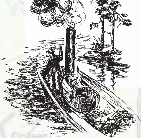
Lerka for full damp på Børteren. Illustrasjon av Lillemor Aars, fra boka «Livet på skauen», utgitt 1937.

Vil man til Børtervann sørfra, er atkomsten stengt gjennom Børter gård, men man kan følge gårdsveien til fots forbi Ekeberg gård til Kongsvika. Her lå tidligere plassen Støa, bebodd til 1880-årene. De søndre deler av Børtervann har drikkevannsrestriksjoner, slik at rasting og bading er forbudt. Kano-paddlere må trille kanoen de fem kilometrene fra Bysætermåsan, gjennom Rausjøgrenda til Tangentjern. Vinterstid er det for øvrig ypperlig å bruke både skøyter, ski og spark på Børteren, som er hele syv kilometer lang fra nord til sør.