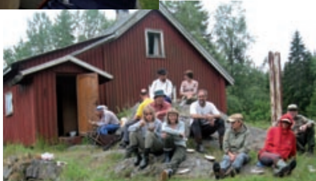
Under: Bøvelstad – klar for reservattur.