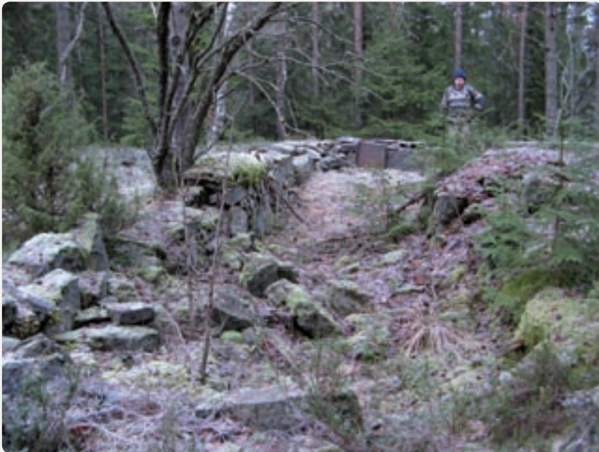
Tuften etter Oslo Skiklubbs hytte ved Høyås.

Lørdag 8. november, med start fra Rustadsaga kafé kl. 11.