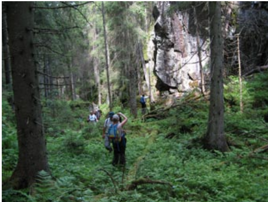
Reservatstemning i vestre Krok tjernsdråg.

Vi overveier sterkt om vi til neste år skal sette opp gjerde rundt gården og slippe sau på beite. De må i så fall fraktes inn med båt. Den som har gått til fots til Bøvelstad, vet at det kan være leit nok for oss mennesker å ta seg fram om man ikke skal drive en saueflokk foran seg også. Vi vil da annonsere etter frivillige «gjetere/budeier» som kan bo der inne i perioden mai/juni for å se til dyrene. Dette får vi komme tilbake til i løpet av vinteren. DNT Oslo og Omegn går kanskje allerede nå i høst i gang med å sette i stand hovedbygningen, slik at vi snart får enda en overnattingshytte i Østmarka. Med restaurerte hus, røyk fra pipa, dyr på beite og lys i vinduene er enda et viktig kulturminne reddet!