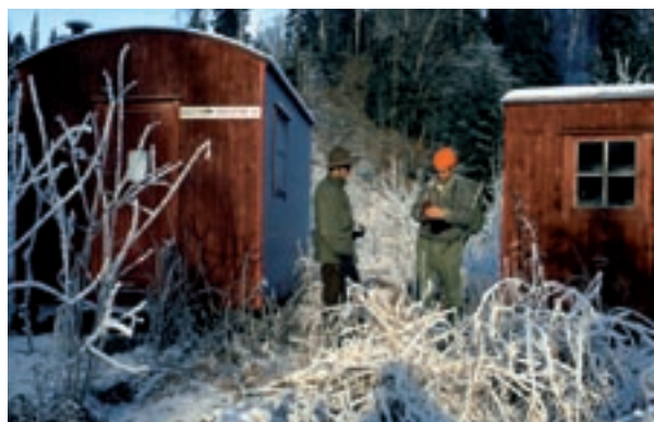
I Deliseterdalen stod det to brakker side om side fra vinteren 1960 til den ene brant ned i 1971 (den til høyre på bildet). Foto: Tom Eriksen, ca. 1970

Vinteren 1960 ble to rødmalte skogsarbeiderbrakker og en lemmestall slept med traktor og doning fra Rausjøgrenda over Børtervann og inn i den trange Deliseterdalen. Her ble husvære for hest og tømmerhoggere plassert på en åpen, liten voll mellom ulendte koller og dråg, en snau kilometer nord for Børtervann. En god del år før dette var en hestevei, en såkalt driftsvei, blitt bygd innover Deliseterdalen og opp til Søndre Kytetjern. Den ble blant annet brukt til å kjøre tømmeret ut fra Strusåsen – stokkene ble først rullet ned den stupbratte «Strusåsleppen» og ut på S.Kytetjern.