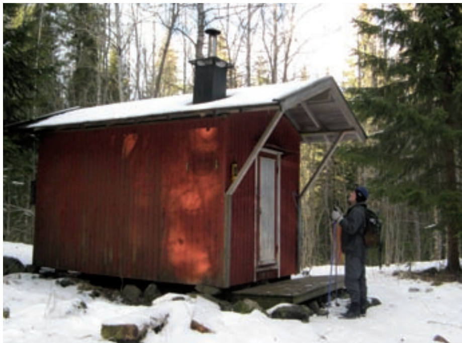
Slik ser Brakka ut i dag, med tak, ny pipe og tram. mars 2008.

De to brakkene i Deliseterdalen ble etter hvert stående ulåste og benyttet året rundt av turgåere og sportsfiskere. Det var en god del friluftsglad ungdom fra bla. Oppsal, Bøler, Bogerud og Lambertseter som pakket sekken og dro langt til skogs i helgene. Flere var medlemmer av Osloomarka Trekkhund-