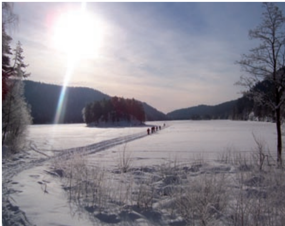
Februarsol over Lutvann.

Regjeringens forslag til markalov er oversendt Stortinget og ligger nå til behandling i Energi- og miljøkomiteen. Det er fortsatt mulig for interesseorganisasjoner og andre å påvirke komiteens behandling gjennom deltagelse på befaring og en åpen høring i Stortinget. Det er heldigvis lagt opp til en rask behandling med avgivelse av innstilling fra komiteen før påske, slik at saken blir behandlet av Stortinget før sommeren.