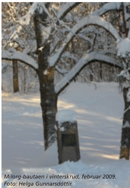
Milorg-bautaen i vinterskrud, februar 2009.