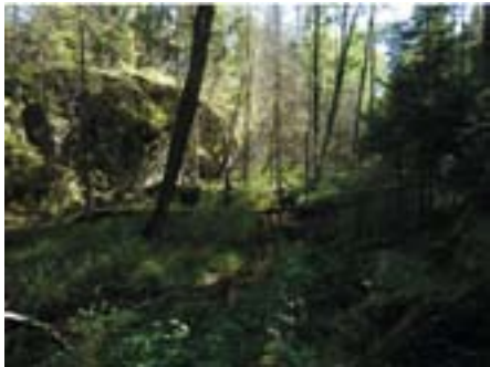
Sølvdoblabekken mot sør.

Den idylliske plassen Dølerud ligger midt i området. Den kan restaureres og eventuelt