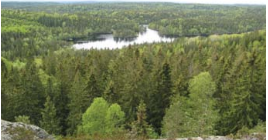
Utsikt fra Tonekollen og over Tonevann og store deler av det det foreslåtte området med Skogsmåsan og Paradisåsen i det fjerne.

I Stortingsproposisjon 1 S (2009–2010) fra Miljøverndepartementet, er INON (inngrepsfrie naturområder i Norge) et eget arbeidsmål som går ut på å «sikre at attværande naturområde med urørt preg blir tekne vare på».