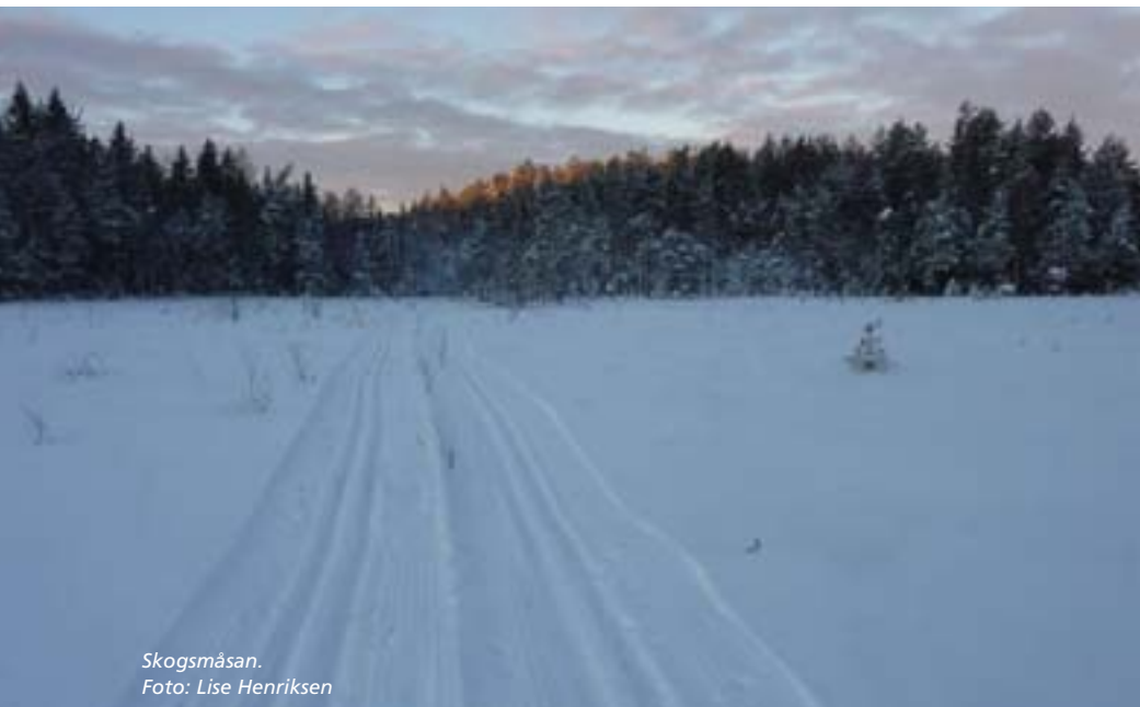
Skogsmåsan.