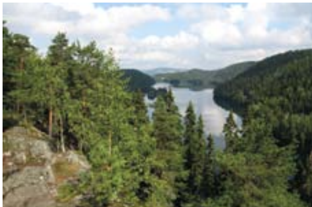
Utsikt over Lutvann.

Området har et uberørt preg og det er flere delområder med gammelskog/bevaringsskog som er «fredet» i Flerbruksplanen for Oslos kommuneskoger. Området blir mye brukt av befolkningen og er av den grunn også verneområde for friluftsliv i Flerbruksplanen. Området ligger i kort avstand fra bebyggelsen som strekker seg fra Lindeberg, Trosterud og Haugerud i nord via Oppsal til Bøler i syd. De mest brukte innfallsporene er Østmarksetra og Lutvann leir. Området er på ca 1900 da.