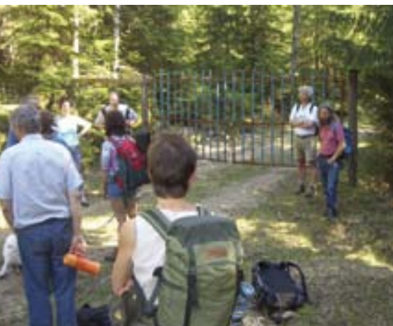
På tur langs Flyktingeruta ble våre medlemmer møtt av denne låste porten ved Fudalen.

Det viktige med den nye friluftsløven er at kommunene eller departementet nå har hjemmel til å gjennomføre enkle tiltak for å lette ferdselen i utmark og å ilagge tvangsmulkt dersom ikke stengsler eller skilt til hinder for lovlig ferdsel fjernes. I tilfellet Ekebergdalen i Enebakk er det mulig å legge en tursti mellom de to eiendommene uten større sjenanse for noen av gårdene, men ikke engang dette alternativet har man til nå greid å bli enige om. Østmarkas Venner krever nå at saken løses juridisk, om nødvendig ved å ilagge tvangsmulkt.