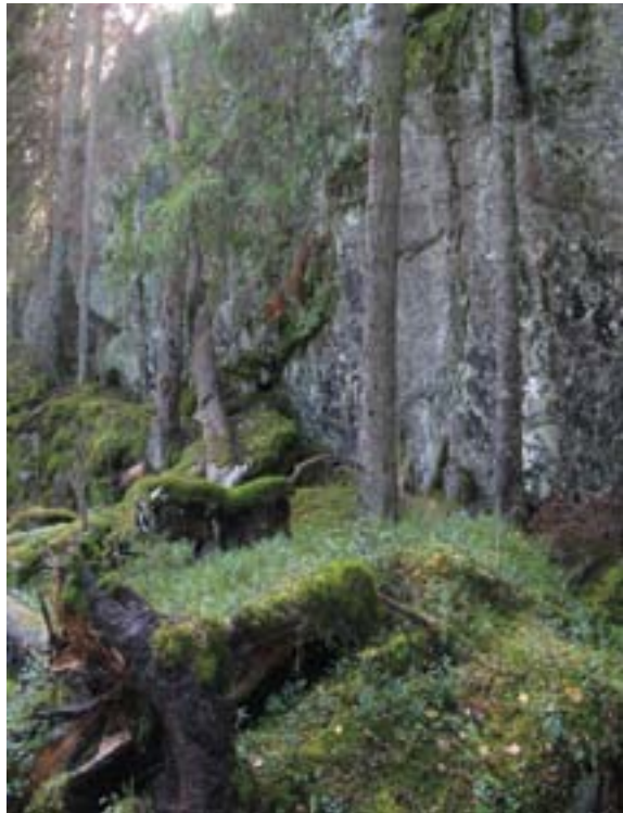
Dråget mot Spinneren.

Området har et stort mangfold av naturtyper og inneholder viktige viltlokaliteter. Området er et særlig viktig friluftsområde som brukes svært mye av befolkningen, i all hovedsak for fotturer vår, sommer og høst. Området er derfor administrativt fredet av Oslo kommune. Området ligger mellom Østmarkskapellet i nord og Sandbakken i sørøst og i relativt kort avstand fra utfartsparkerene ved Grønmo og Sandbakken. Området er ca 1900 da stort.