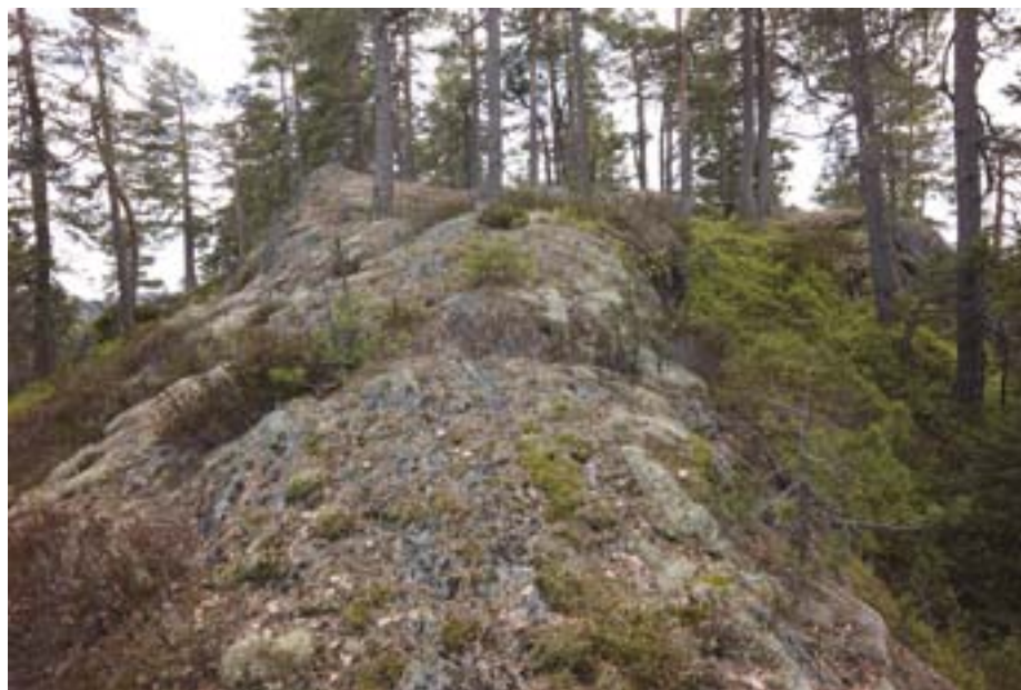
Skarpdunderen: Tenk deg Skarpdunderen uten trær, lyng og mose. Da får du Gaustatoppen.

stole helt og fullt på. Skarpdunderen er et slikt sted, og det er med blandende følelser jeg nå lar den få en plass i rampelyset. Lov meg én ting hvis du tenker deg opp dit: Forlat den like vakker og uberørt som du fant den, slik at toppen kan bli til samme glede for alle de som orker å klatre helt opp de steile veggene.