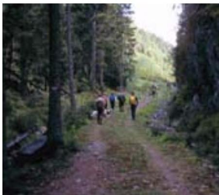
Flyktningeruta gjennom Fudalen.