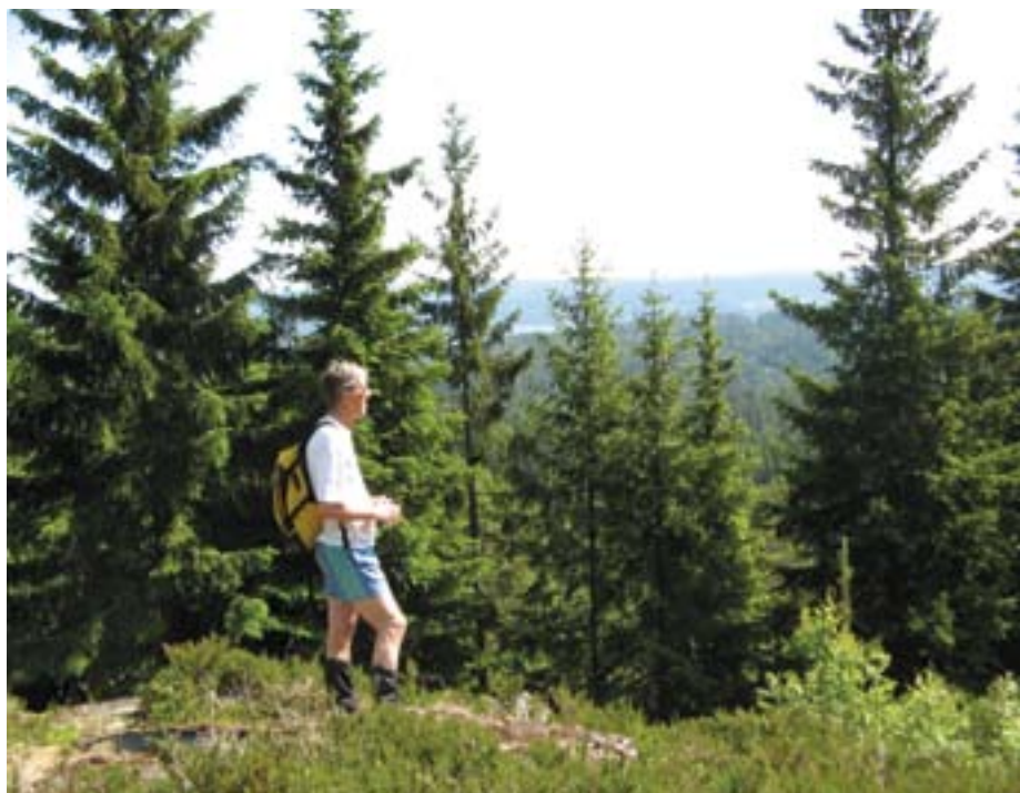
Utsikt fra Knatten sør Hengeberget sørøst.

Området er ca 3600 da. Området er ikke befart, og grensene kan derfor trenge justering.