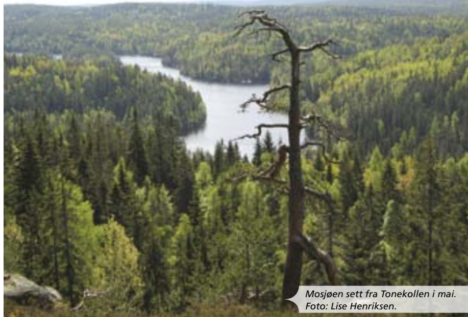
Mosjøen sett fra Tonekollen i mai.