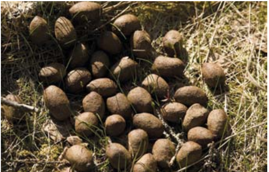
Elgen har vært her!

På Dunderen kan du høre slagene fra golfbanen, samtidig som opplever stillheten bare skogene kan by på. Du er likevel ikke alene her, for sporene etter elg er mer enn tyde-