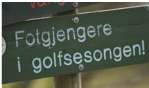
Og hva nesten verre er: I tursesongen kan det vrimle av golfere her!

lige nok. Jeg sørget for å ha kameraet klart før hver sving og bakketopp, og plutselig sto den like foran meg. Med ryggen til, slik at den skulle kunne stikke av på kort varsel, men likevel nysgjerrig skulende som for å finne ut hva for en fyr dette kunne være? Jeg kan leve høyt i mange uker på møtet med et så flott og grasiøst dyr. Han lot meg ta noen bilder for å illustrere denne artikkelen. Til gjengjeld måtte jeg love å fremføre mitt prinsipielle synspunkt om at elger er mye flottere i naturen enn på middagstallerkenen. Jeg innrømmer mer enn gjerne at jeg etter hvert møte med skogens konge får det vanskeligere for å spise kjøtt. Jegerne kan si hva de vil. Dessuten var elgen genuint fotointeressert, og stilte seg i tre-kvart positur, omtrent slik som når man skal fotografere