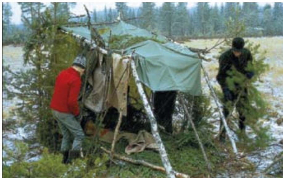
Far og sønn ved gapahuk på tiurleik.