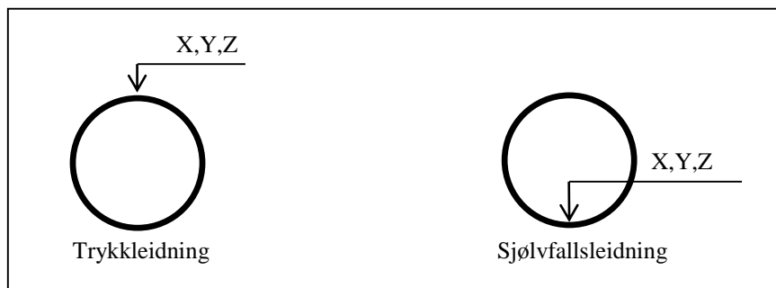
Figur 1. Måling av leidningshøgde.