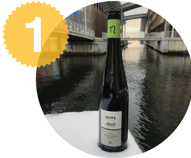
1, Leitz Rüdesheimer Berg Roseneck 2015