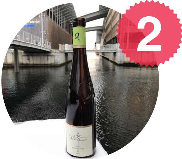
2, A. Christmann Meerspinne GG 2015