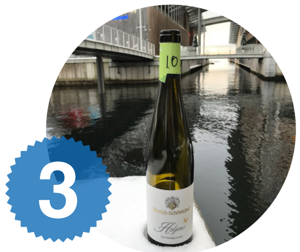
3, Emrich-Schönleber Haligans 2015