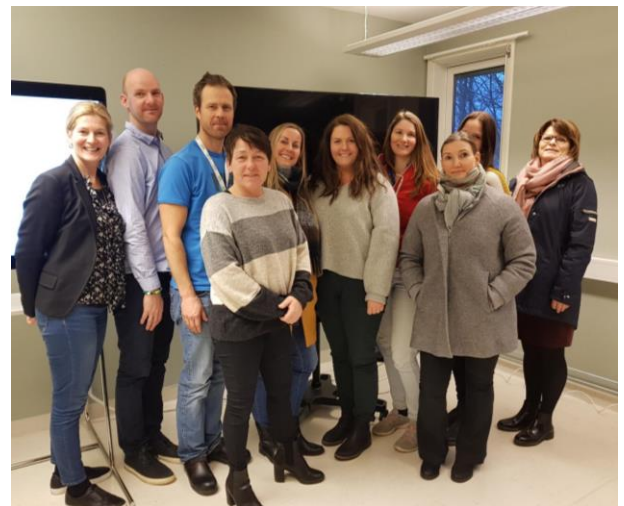
Bildet viser noen av deltakerne på Samordningsmøte for TVT: Representanter fra kommunene; Eidsberg, Marker, Skiptvet og Askim og noen representanter fra TVT samt prosjektleder.

Samordningsmøter med TVT og kommunene holdes vår og høst for å sikre og utvikle gode samarbeidsrutiner. For TVT og prosjektet er det viktig med en tett dialog med våre samarbeidspartnere. Deltakerne på møtet nå i desember, bidro med konstruktive innspill for å drive samordningen videre. Bildet viser noen av deltakerne.