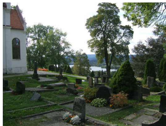
Heggen kirkegård, felt 25. Nordvest for kirken.