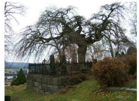
Heggen kirkegård, felt 17: Wigersund familiegravsted

De typene gravminner som dominerer Heggen 2 i bevaringssammenheng, er liggende gravminner, enten i jern (K) eller stein (L). Dette er de eldste typene gravminner som finnes på kirkegårdene, og de er viktige å bevare i alle tilfeller. Femten liggende jernplater og ti liggende steinplater er satt til bevaring på Heggen 2. De aller fleste av disse typene er ikke festet, da gravminnene er svært gamle. Men likevel er fem av jernplatene på felt 17 festet, og to av dem er fortsatt i bruk.