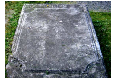
Liggende steinplate: 1-25-3-14

Heggen 2 har bare ett gravminne av reliefftypen (I). Dette er naturligvis satt til bevaring.