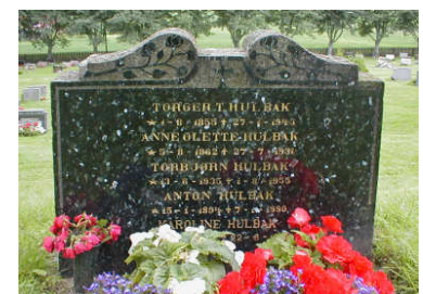
Liggende, rekatangulært gravminne (C).

13 av de 16 gravminnene til gjenbruk er i privat eie.