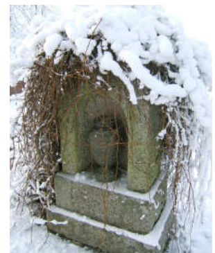
1-17-8-11: Nisje med urne