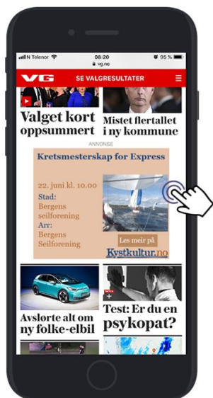
Board Mobil 320x250 px