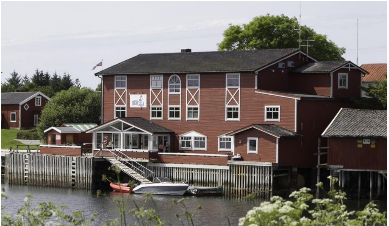
1. Herøy brygge