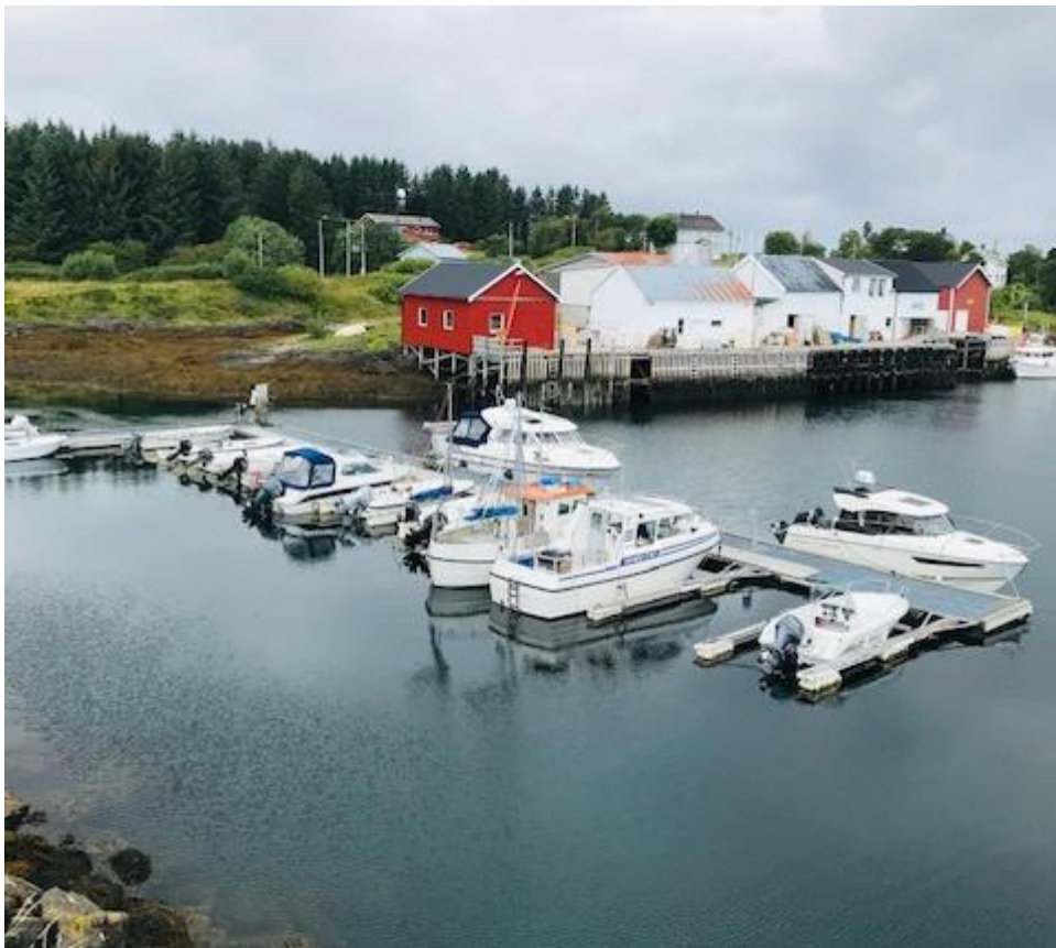
3. Brasøy Handelssamvirke AS