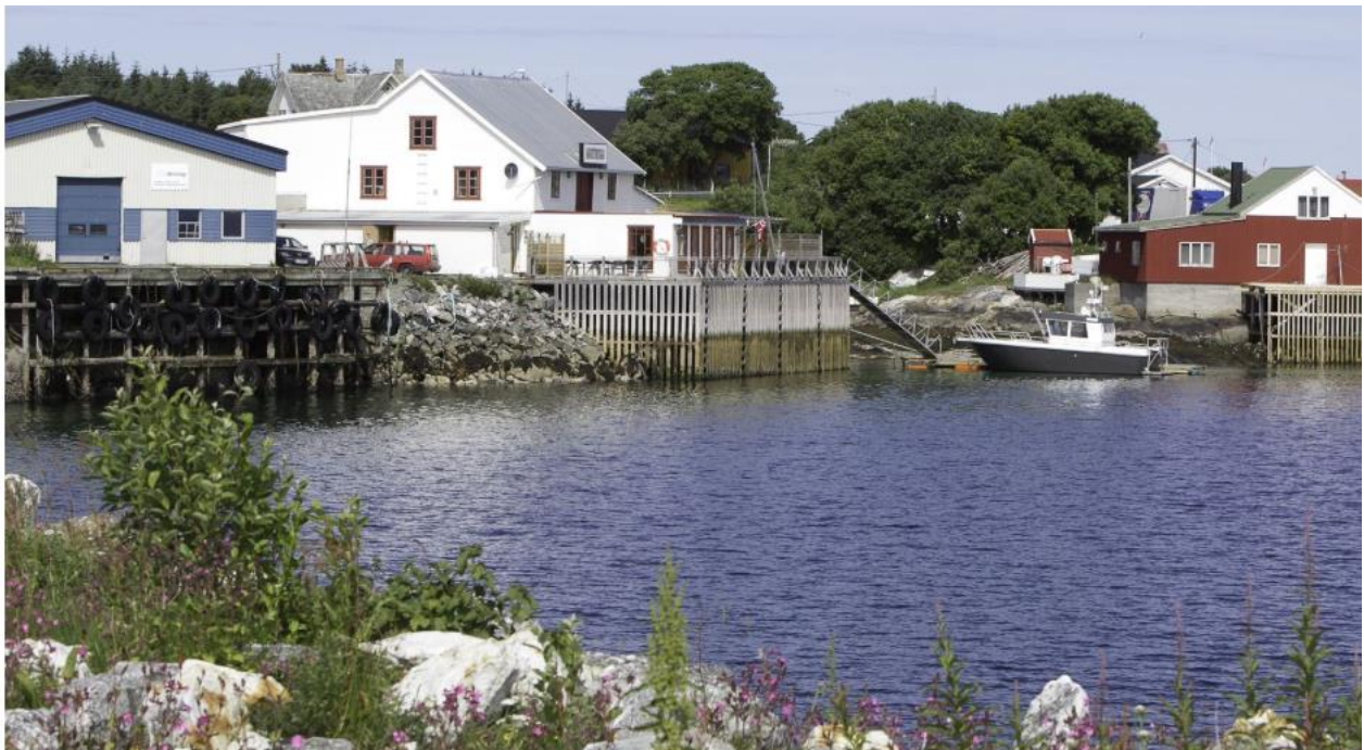
6. Flatøya Seløy(Kaikanten Herøy AS)