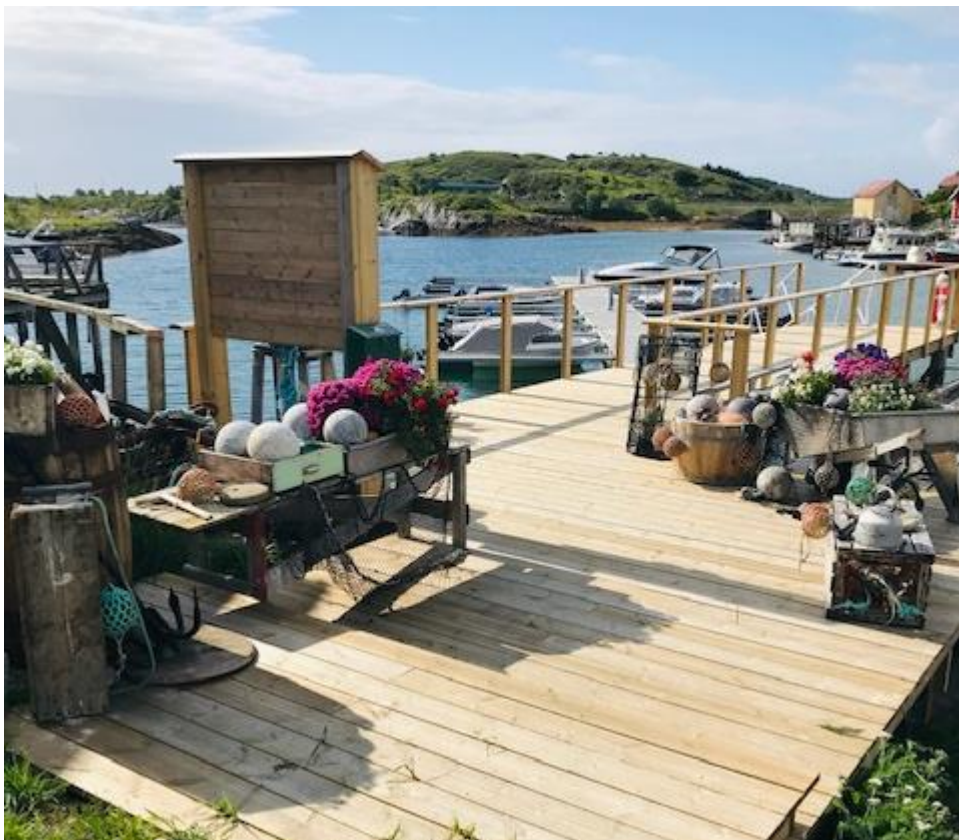
4. Husvær småbåthavn SA