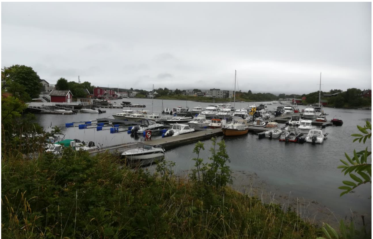
2. Herøy Båtforening, Herøysundet marina