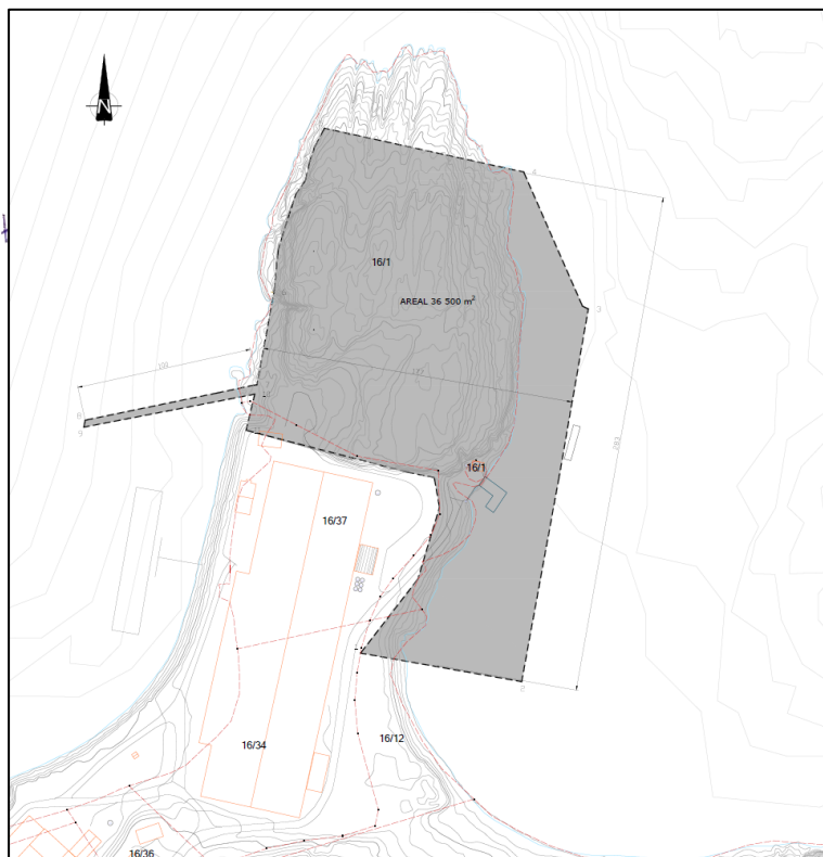
Figur 2 Foreløpig skisse av tiltaket. Tegning: Rambøll