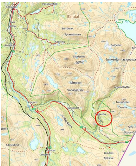
Figur 1 Planområdet beliggenhet, vist med rød ring.