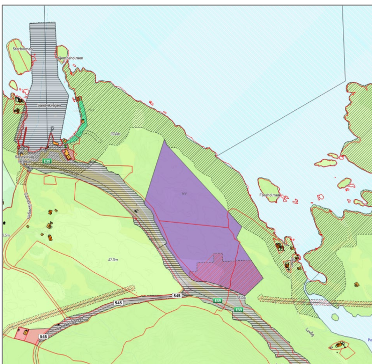
Figur 1 Utsnitt kommuneplanens arealdel

I kommuneplanens arealdel er delar av arealet synt som næringsverksemd (framtidig), medan resterande areal er avsett til LNF (noverande). Det er synt faresone H310_15 Ras- og skredfare i området, og langs sjø er det synt omsynssone landskap; funksjonell strandzone. Allereie regulerte område langs E39 er synt som omsynssone Reguleringsplan skal fortsatt gjelde. I sjø er det synt kombinerte føremål FFNF (Fiske, ferdsle, natur- og friluftsområde) og NF (Natur og friluftsområde).