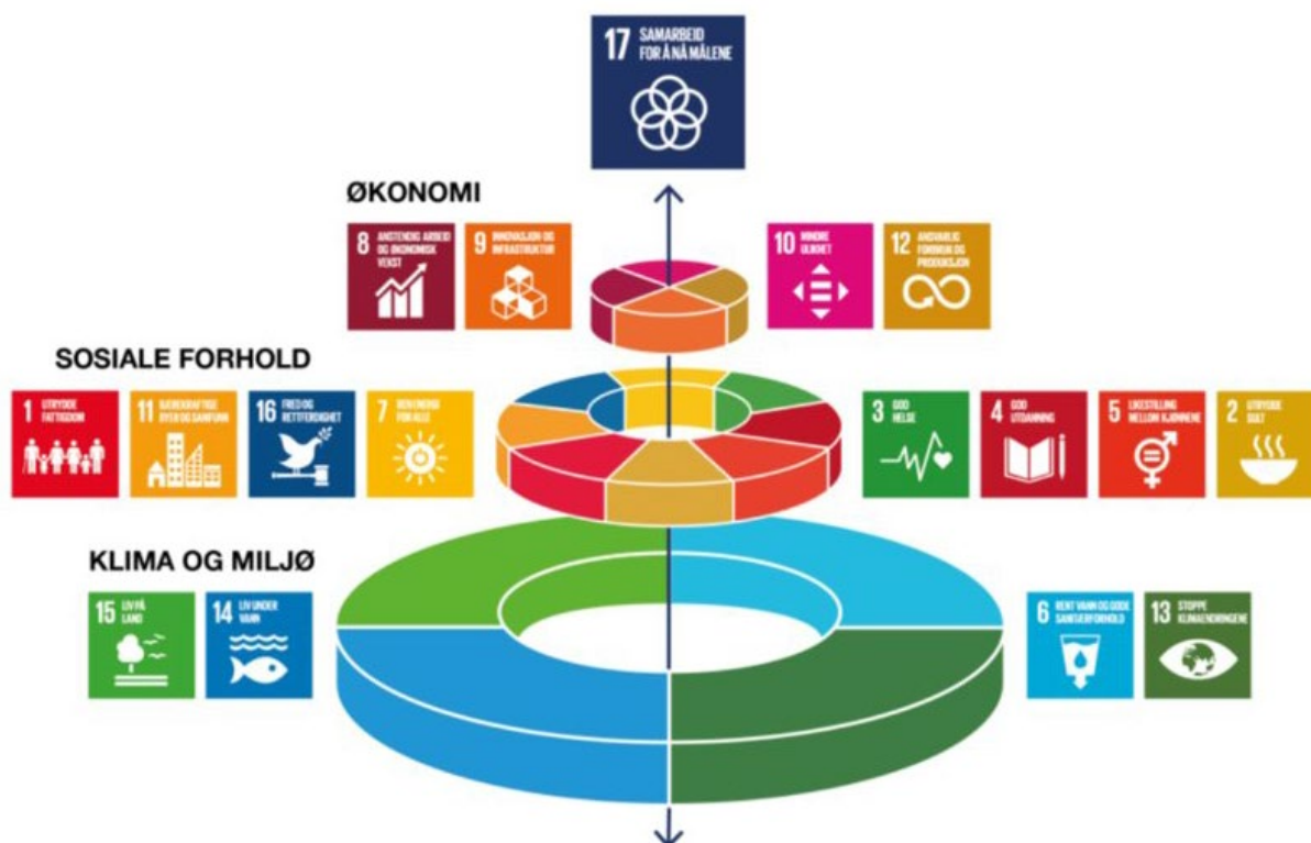
Figur 3: FNs bærekraftsmål sett i sammenheng.

Figuren ovenfor viser bærekraftsmålene i et hierarkisk system, hvor de fire bærekraftsmålene som omhandler klima og miljø danner grunnlaget for de øvrige målene. Dersom man ikke klarer å ivareta disse fire, vil man ikke ha noen øvrige bærekraftsmål å arbeide med. Deretter bygges pyramiden oppover med sosiale og økonomiske forhold. Til sist topper bærekraftsmål nr. 17: Samarbeid for å nå målene.