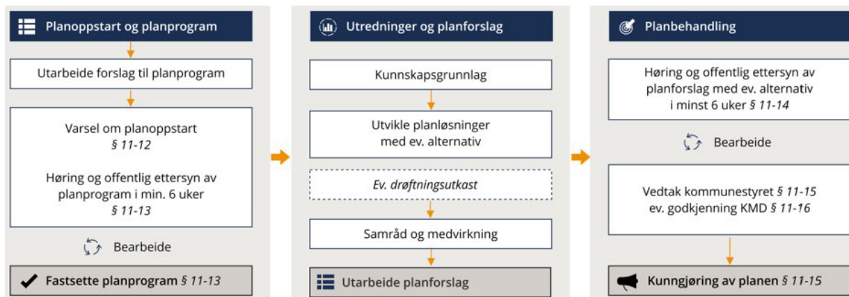
Figur 1: Prosessen ved revidering av kommuneplanens arealdel

Prosessen for revidering av arealdelen foregår som vist i figur 1: