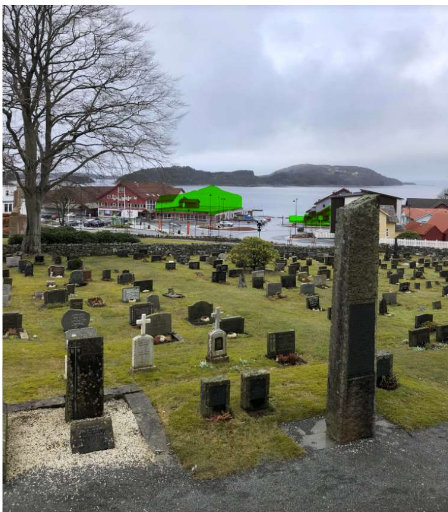
Bilete tatt frå kyrkjetrappa

Det tillates ein ekstra etasje på Larsenbygget, men ingen ting på 65/24. Dette er ekstrem forskjellsbehandling om ein tar utgangspunkt i den såkalte Kyrkjeaksen. Det er ynskje frå Todlak og Sameie Fitjarsjøen 24 med mulighet for car-porter på parkeringsplasser tilknytta leiligheter i Bankbygget. Dette er lavtbyggjande konstruksjoner og tar ikkje meir sikt enn skissert, samt utviding av bygget mot gata.