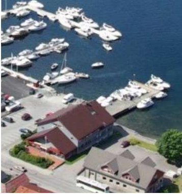
Kaien bærer preg av ikkje privatisert kai.

Føremålet skal nyttast på samme grunnlag som SK3. Dvs del av det totale grunnlaget for brygger tilgjengelig for nattleige. Flytebrygger kan knyttes til kai. Kai kan forlenges om den erstattes. Enkle tiltak på kaien som er tilrettelagt bruk for allmenheten tillates. Tiltaka skal ikkje være privatiserande.