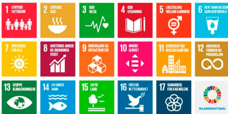
FN sine 17 berekraftsmål

Regjeringa har bestemt at dei 17 berekraftmåla til FN, som Noreg har slutta seg til, skal vere det politiske hovudsporet for å ta tak i dei største utfordringane i vår tid, også i Noreg. Det er derfor viktig at berekraftmåla blir ein del av grunnlaget for samfunns- og arealplanlegginga.