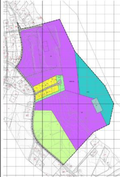
Fig. nr 5.2. Alt. 1 - Grovskisse plankart ved varsling om oppstart

Utvivelse av industriområdet og etablering av dypvannskai i direkte tilknytning til dette. Illustrert i plankartskisse nedenfor.