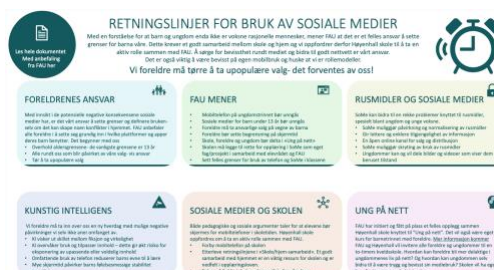
Retningslinjer for bruk av SoMe