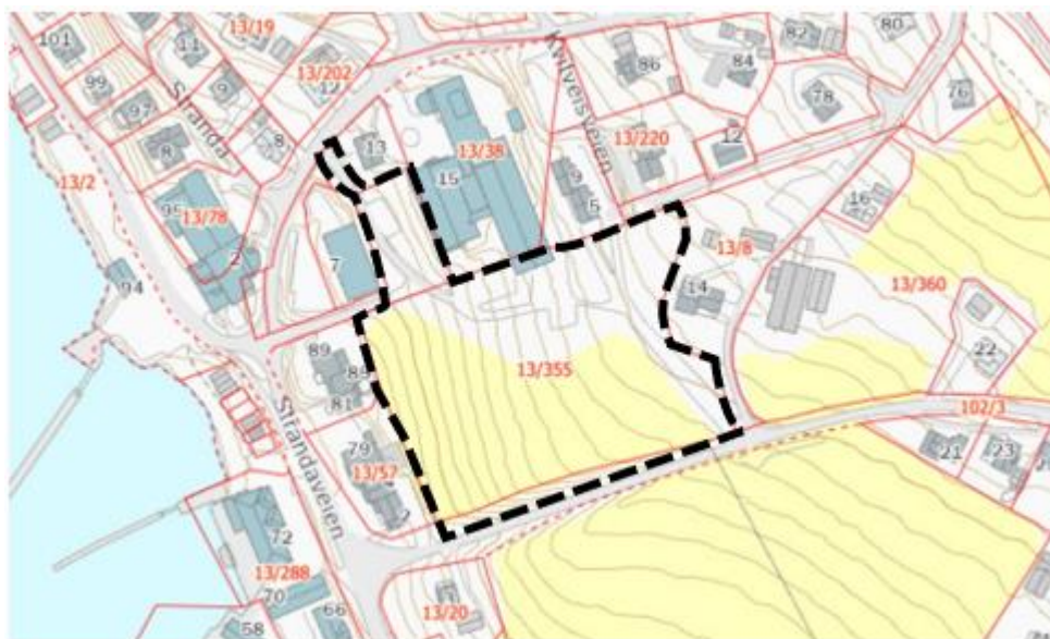
Figur 2 Forslag til planavgrensning.

Planområdet omfatter eiendommene gnr/bnr 13/355, 102/3, 13/25 og 16/37. Samtlige eies av Flatanger kommune.