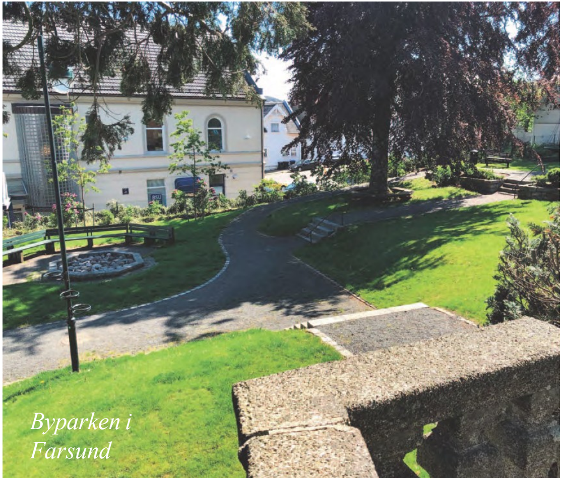
Byparken i Farsund

* Ansvaret beskriver hvem som skal følge opp / ta initiativ til videre arbeid med tiltaket.