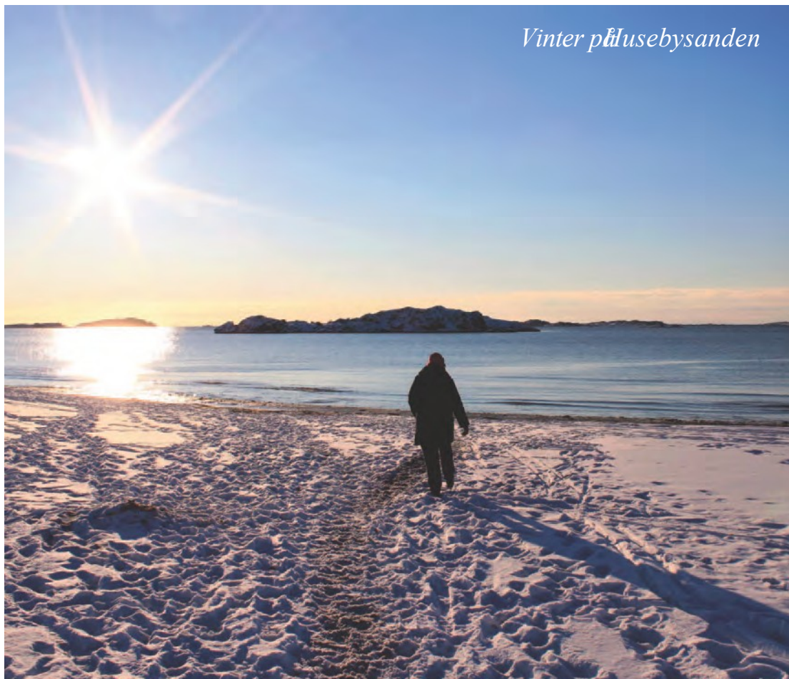
Vinter på Husebysanden