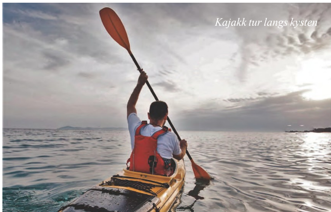
Kajakk tur langs kysten

Som det fremgår av tabellen på neste side skjer det et stort frafall blant ungdommen innen organisert idrett fra 12-13 års alderen, og dette er en utfordring.